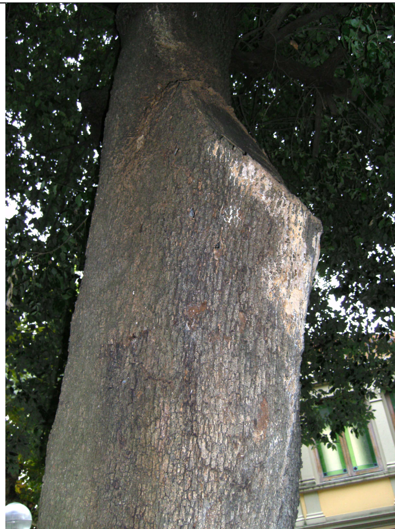
Fori provocati dai Cerambici