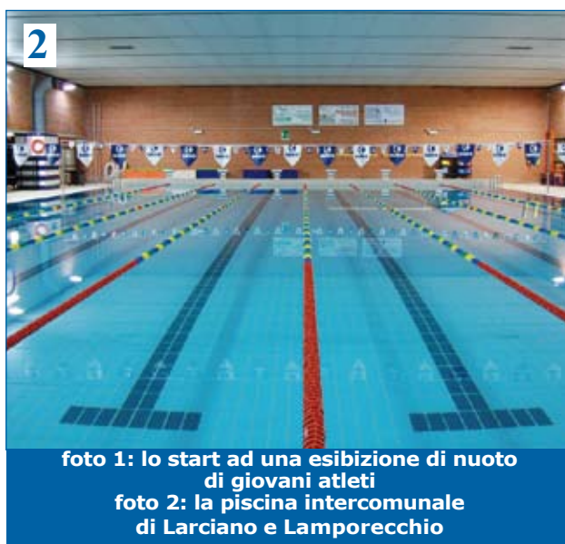
foto 1: lo start ad una esibizione di nuoto di giovani atleti foto 2: la piscina intercomunale di Larciano e Lamporecchio