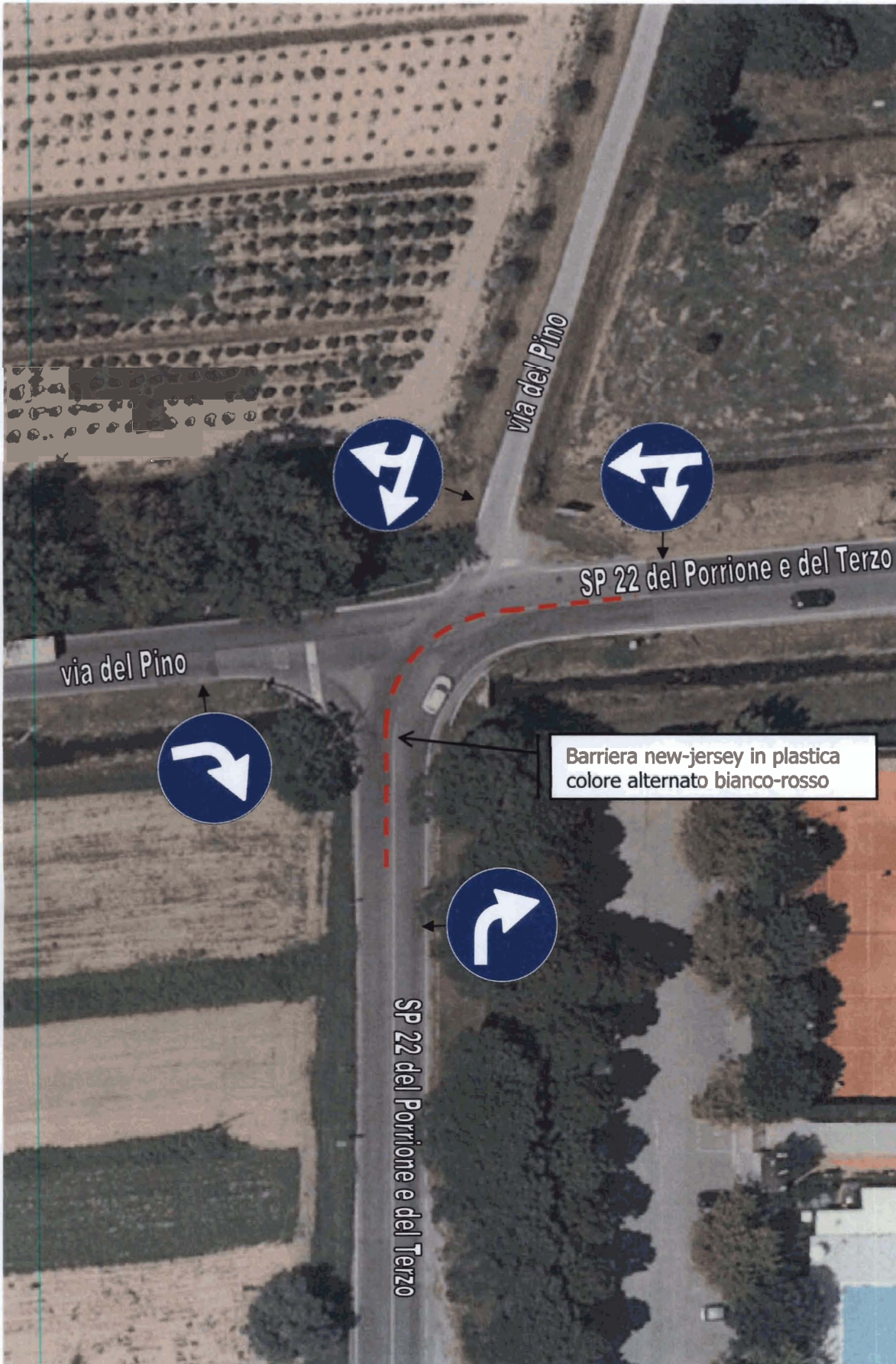
Schema grafico modifica incrocio