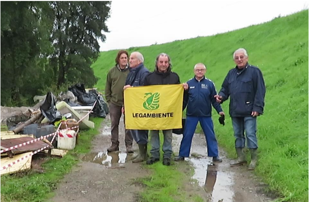
Figura 1 Intervento di Legambiente Quarrata del 16 Novembre 2019 presso le discariche abusive in GAMBERAIA

Legambiente Quarrata , proprio in questi posti, il giorno 11 Febbraio 2017 bonificò una grossa discarica, ma tutto questo non è bastato, perché moltissime altre se ne sono formate ed in questi trecento metri tanti cittadini incivili hanno portato qualcosa e hanno scaricato veramente di tutto di tutto in questo vivaio abbandonato sotto l'argine del torrente Stella in sinistra idraulica con l'aiuto di camion e auto .