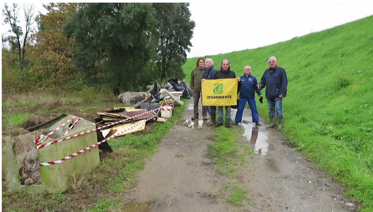
Figura 2 Intervento di Legambiente Quarrata del 16 Novembre 2019 presso le discariche abusive in GAMBERAIA