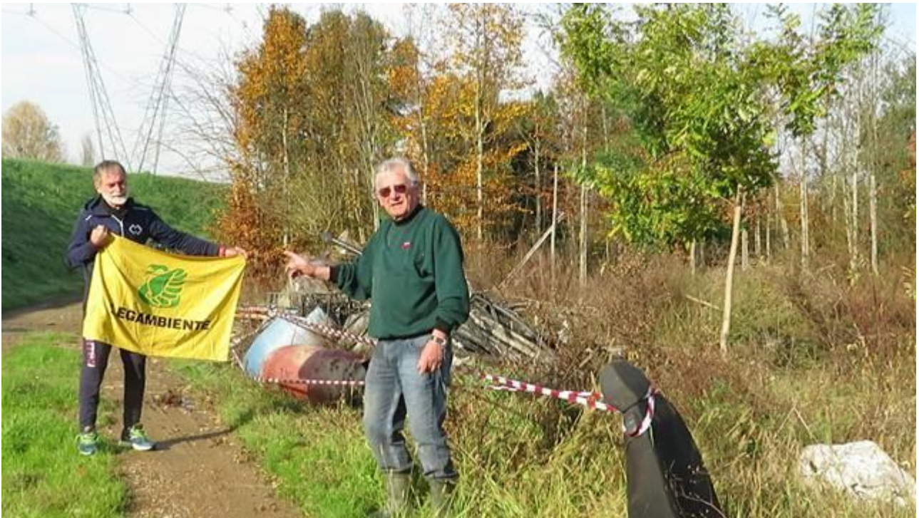
Figura 7- Intervento di Legambiente Quarrata del 26 Novembre 2019 presso le discariche abusive in GAMBERAIA